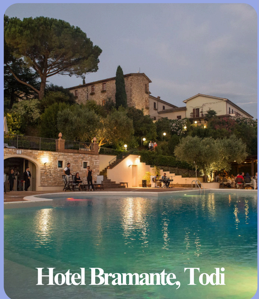
Hotel Bramante, Todi